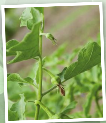
ผักสวนครัวประจำ บ