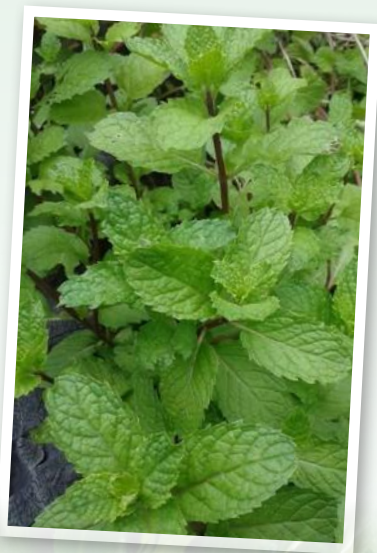
ผักสาบัญประจำ บ