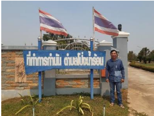
กำนันตำบลโป่งน้ำร้อน อ. ฝาง จ.เชียงใหม่