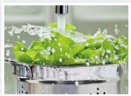
ผักสดล้างประจำ วัน

9. แช่น้ำยาล้างผักนาน 10 นาที และล้างด้วยน้ำสะอาดอีกครั้ง ลดปริมาณสารพิษตกค้างได้ร้อยละ 22-36