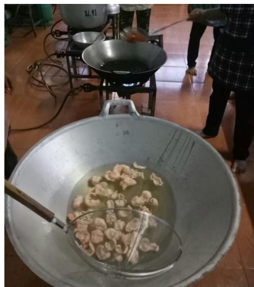
การทอดข้าวเกรียบ