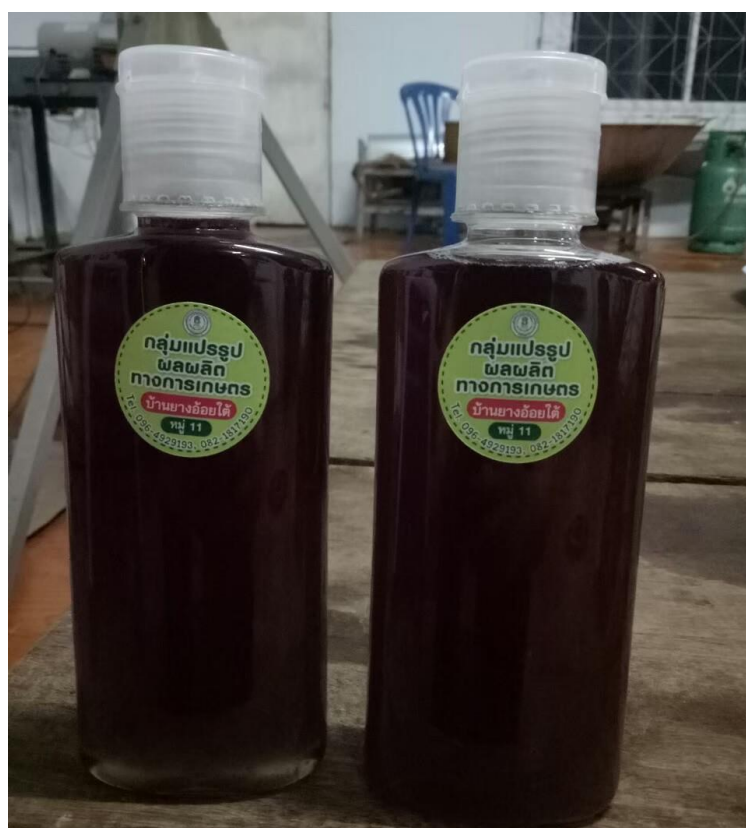
ผลิตภัณฑ์แอมพูฉัณษณ์มะกรูด (การแปรรูปผลผลิตทางการเกษตร)