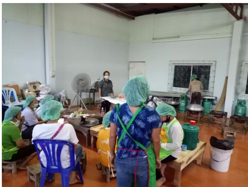
การรวมตัวของกลุ่มบ้านยางอ้อยใต้

ช่องทางการจำหน่าย: ขายภายในชุมชน, ฝากขายตามร้านค้าในชุมชน