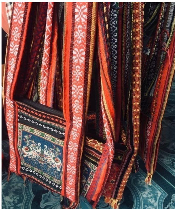
ถุงย่ามที่เย็บประกอบเสร็จเรียบร้อยแล้ว