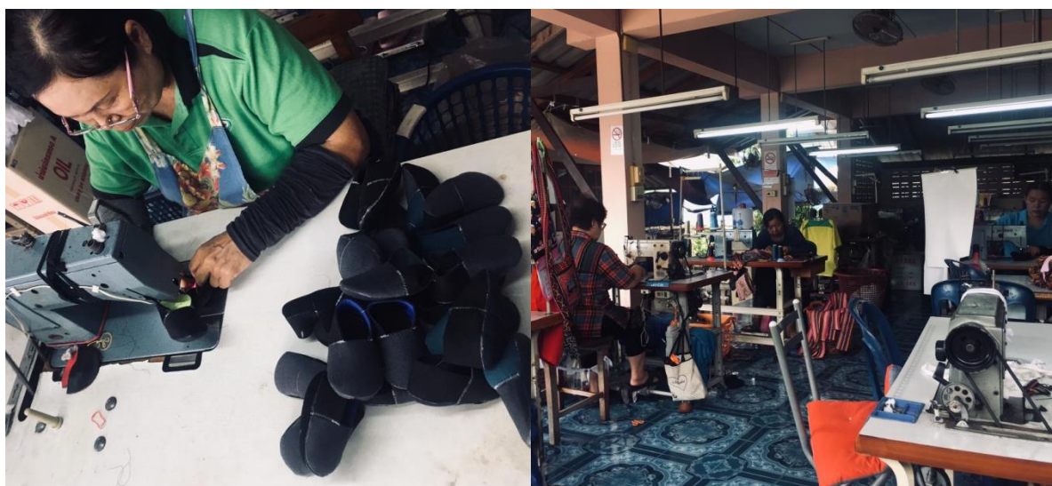
กลุ่มอาชีพเย็บรองเท้าบ้านยางอ้อย