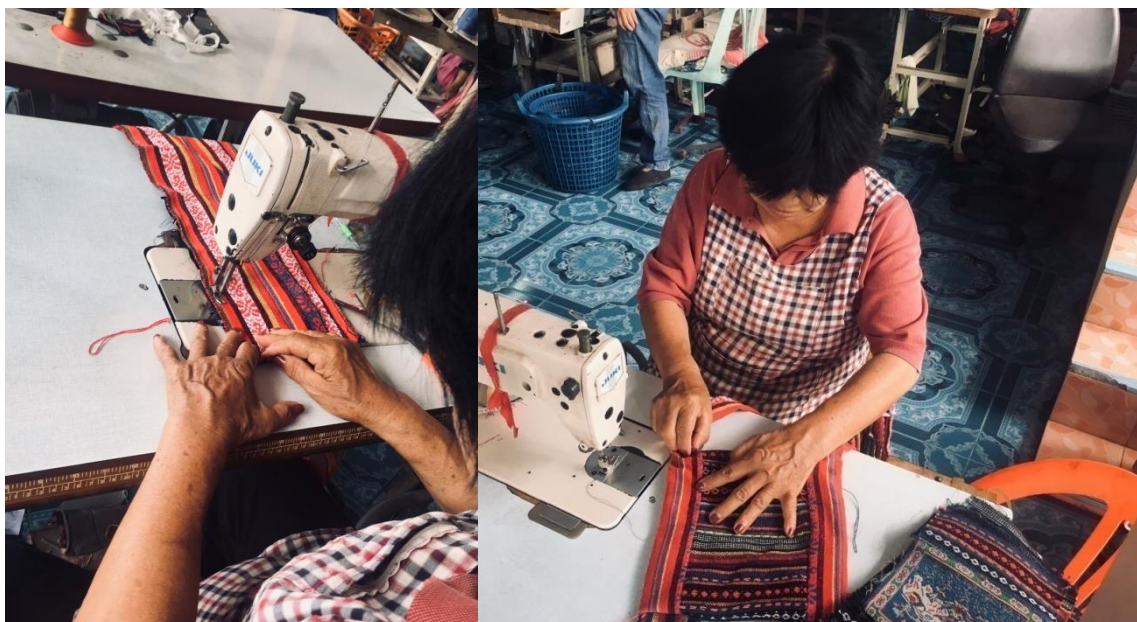
การเย็บประกอบถุงย่ามที่ลูกค้าส่งผ้ามาให้เย็บประกอบ

ในปัจจุบันกลุ่มอาชีพเย็บรองเท้าว้าบ้านยางอ้อยได้มีการประชาสัมพันธ์ตามสื่อและโครงการต่างๆ เช่น Facebook ออกนุทขายสินค้าตามโครงการต่างๆตามที่รัฐจัดตั้ง จึงทำให้เป็นที่รู้จักกันในวงกว้าง และมีลูกค้าสั่งทำสินค้าเข้ามาเรื่อยๆ ปัจจุบันลูกค้ารายใหญ่จะเป็นลูกค้าที่มาจากจังหวัดแพร่ ที่มีการนำผ้า วัสดุ อุปกรณ์ต่างๆ เพื่อมาให้กลุ่มอาชีพเย็บรองเท้าว้าบ้านยางอ้อยตัดตามแบบ สินค้ามีดังนี้ 1.รองเท้าว้า 2.กระเป๋า ถูย้อมตามขนาดต่างๆ3.หน้ากากผ้า ซึ่งสมาชิกกลุ่มเย็บรองเท้าว้าบ้านยางอ้อยต้องมาเรียนรู้ วิธีทำวิธีเย็บกันเองจนชำนาญ และทำเป็นอาชีพได้