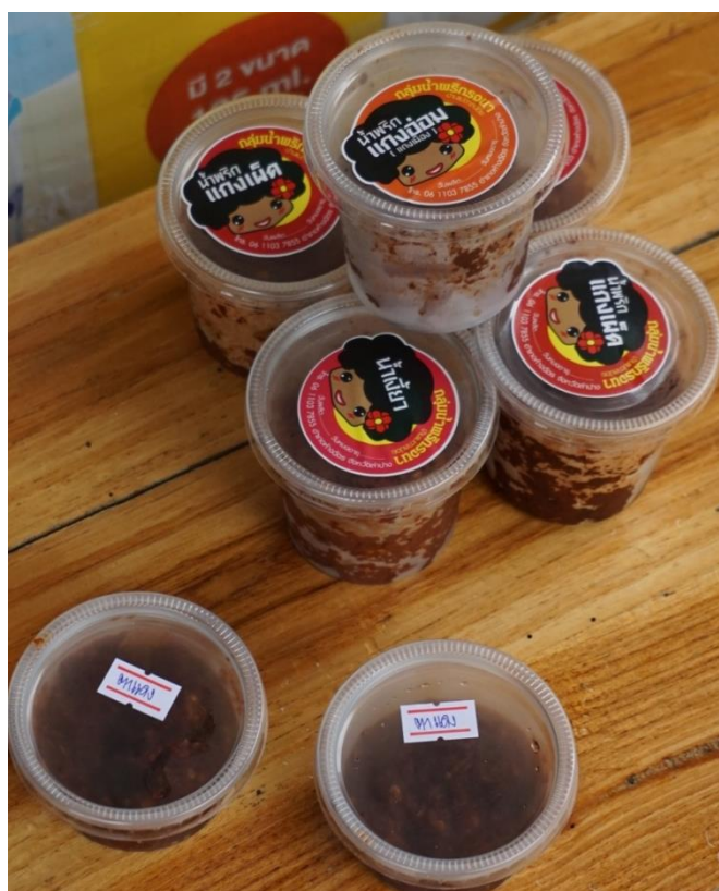
ผลิตภัณฑ์กลุ่มทำน้ำพริกจนา

ราคาจำหน่าย : กระจุกเล็ก ราคา 10 บาท กระจุกใหญ่ ราคา 20 บาท