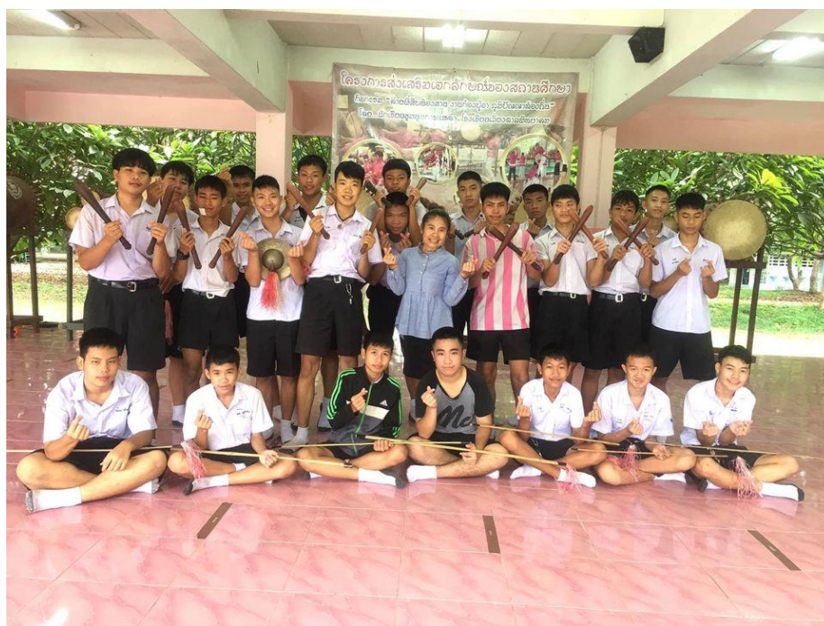
ค่ายพี่สืบน้องสานงานกลองปฐจาภูมิปัญญาท้องถิ่น

การตีกลองปฐจาของนักเรียนโรงเรียนเวียงตาลพิทยาคมเคยชนะการประกวดแข่งขันระดับประเทศโดยเป็นการแข่งขันตีกลองปฐจาซึ่งถ้วยพระราชทานจากสมเด็จพระนางเจ้าพระบรมราชินีนาถ คว่า เป็นแชมป์มา 2 สมัย ระดับจังหวัด การประกวดแข่งขัน การตีกลองปฐจา นครลำปาง นอกจากนี้จะนำการแสดงตีกลองปฐจาไปแข่งขันแล้ว ยังรับการแสดงตามงานต่างๆจากผู้ว่าจ้างให้ไปแสดงตีกลองปฐจา ไม่ว่าจะเป็นการแสดงเปิดงานใหญ่ๆระดับจังหวัดหรือระดับอำเภอและระดับท้องถิ่น