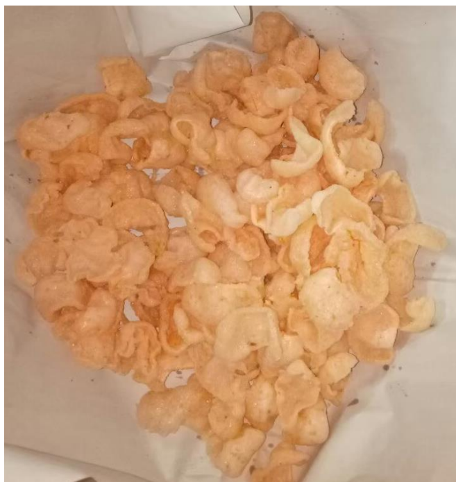
ข้าวเกรียบกุ้ง